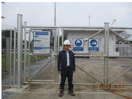
โครงการก่อสร้างท่าอากาศยานนานาชาติไปยังโรงไฟฟ้าหนองระเวียง 1