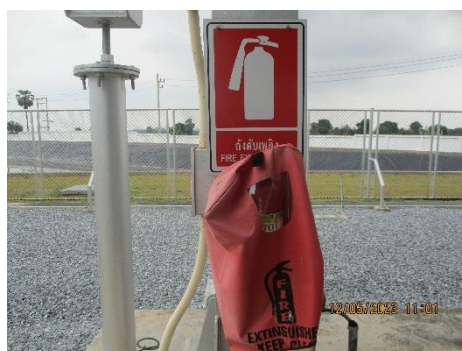
ภาพที่ 2-2 ถังดับเพลิงแบบเคมีผงที่สถานีควบคุมความดันและวัดปริมาณก๊าซธรรมชาติ (MRS)