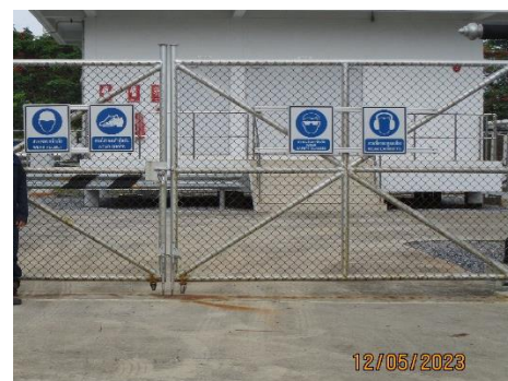
โครงการท่อส่งก๊าซธรรมชาติไปยังโรงไฟฟ้าหนองระเวียง 1