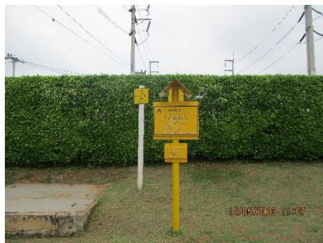
โครงการท่อส่งก๊าซธรรมชาติไปยังโรงไฟฟ้าหนองระเวียง 1