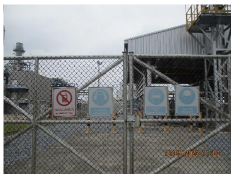
โครงการท่อส่งก๊าซธรรมชาติไปยังโรงไฟฟ้าหนองระเวียง 2