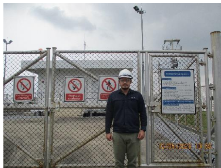
โครงการก่อสร้างท่าอากาศยานนานาชาติไปยังโรงไฟฟ้าหนองระเวียง 2