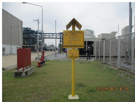
โครงการท่อส่งก๊าซธรรมชาติไปยังโรงไฟฟ้าหนองระเวียง 2