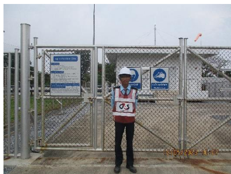
โครงการท่อส่งก๊าซธรรมชาติไปยังโรงไฟฟ้าหนองระเวียง 1