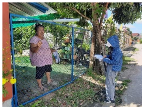
ภาพที่ 2-6 การแจกแผ่นพับการประชาสัมพันธ์โครงการ